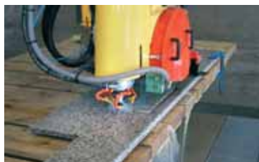
Produzione di top / Tops manufacturing.