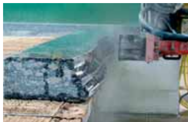
Sagomatura curva / Curved shaping.

Alcuni esempi di realizzazioni tra le molte possibili