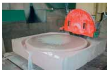
Produzione di elementi rotondi / Round elements manufacturing.