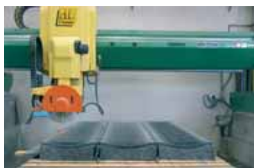
Sbancamento / Scabbling.