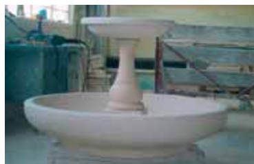
Fontana completa / Complete fountain.

■ Tutti i componenti sono stati sottoposti a verifica strutturale FEM (Finite Element Method).