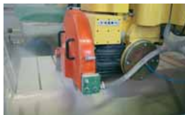
Finitura al tornio con "spatolamento" / "Spatula" finish at the lathe.