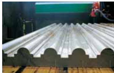
Sagomatura a disco in serie / Serial disc shaping.

A few examples a few examples of realizations among many other possible ones