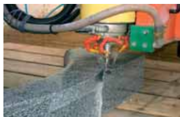
Sagomatura con elettromandrino / Shaping with electro spindle

A few examples a few examples of realizations among many other possible ones